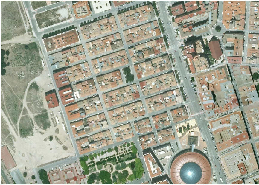
17. Foto 4

Valoración de la trama. Marca solo un óvalo.