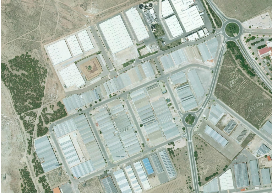
25. Foto 12

Valoración de la trama. Marca solo un óvalo.