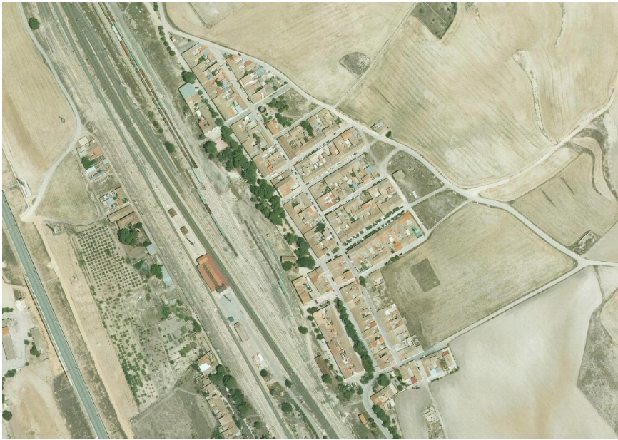
27. Foto 14

Valoración de la trama. Marca solo un óvalo.