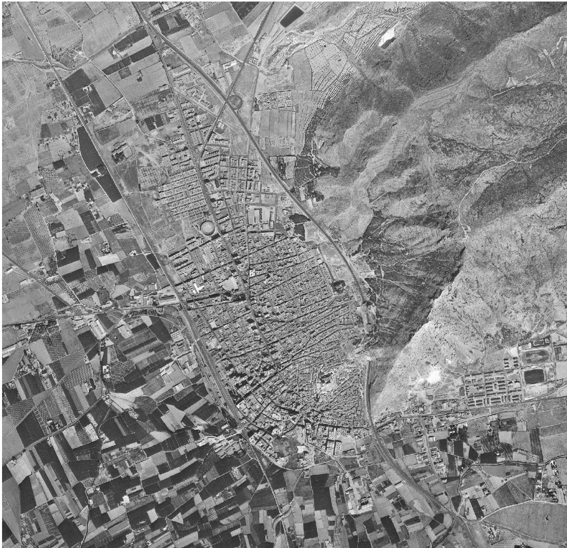
Foto aérea Villena 2014