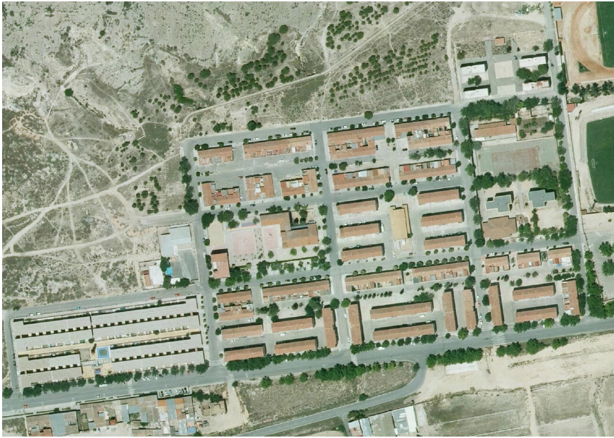
23. Foto 10

Valoración de la trama. Marca solo un óvalo.