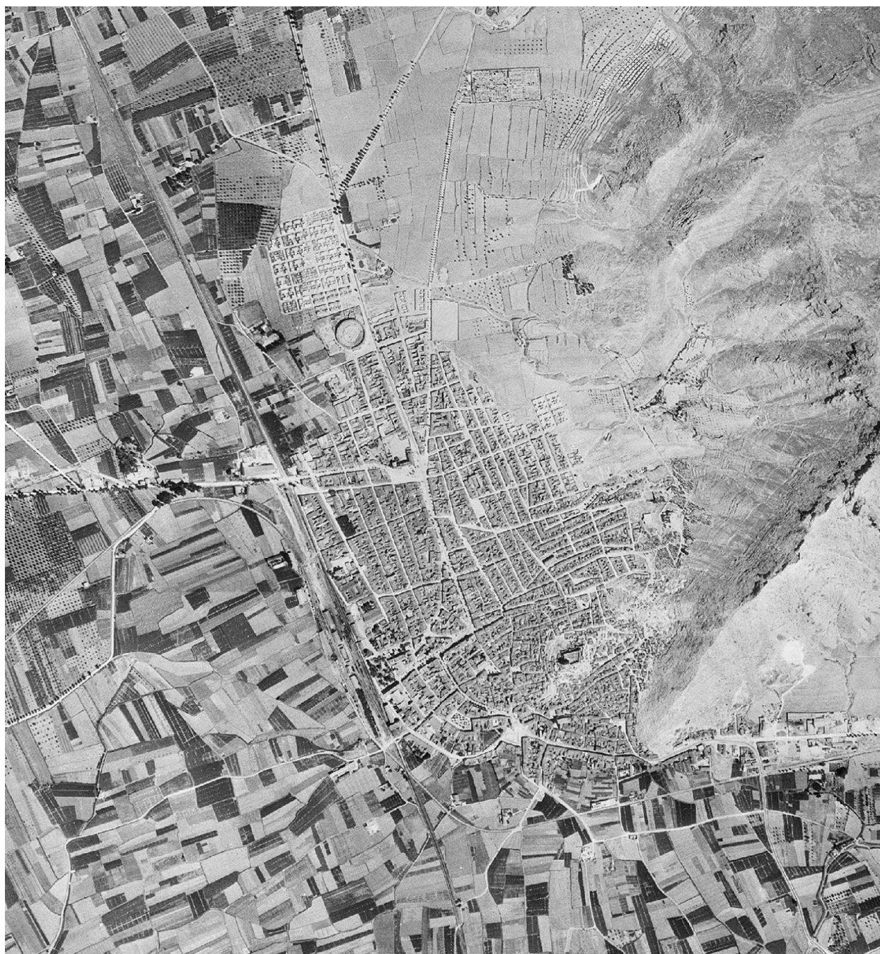
Foto aérea Villena 1956