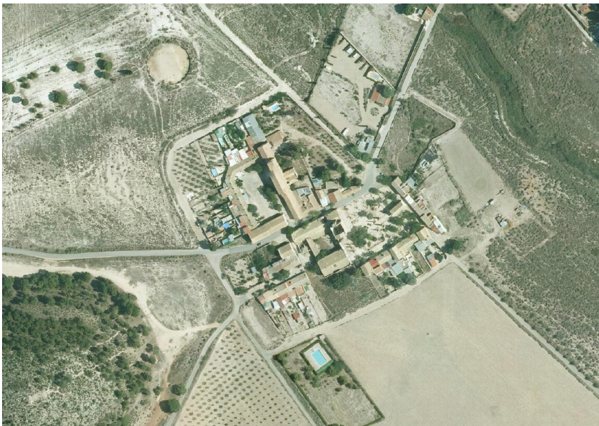
26. Foto 13

Valoración de la trama. Marca solo un óvalo.