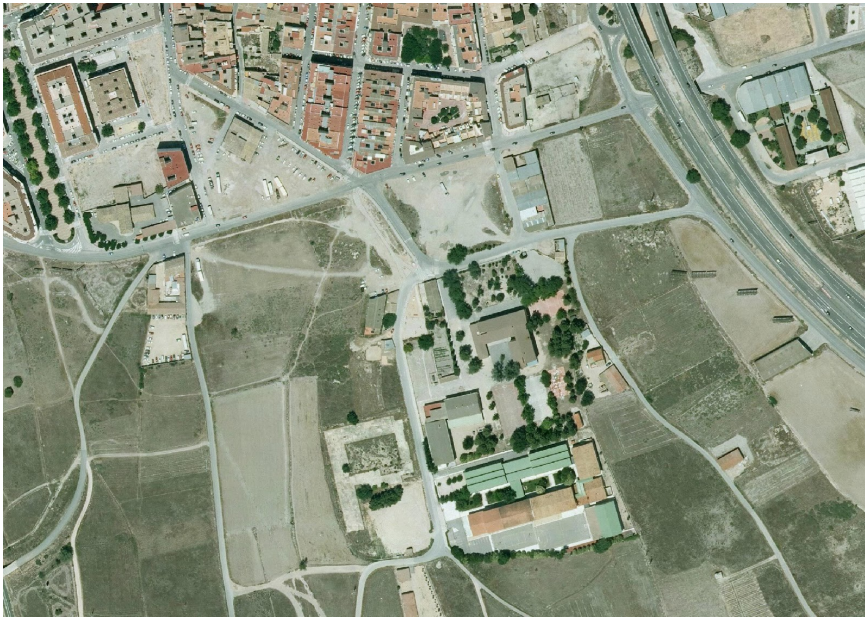
15. Foto 2

Valoración de la trama. Marca solo un óvalo.