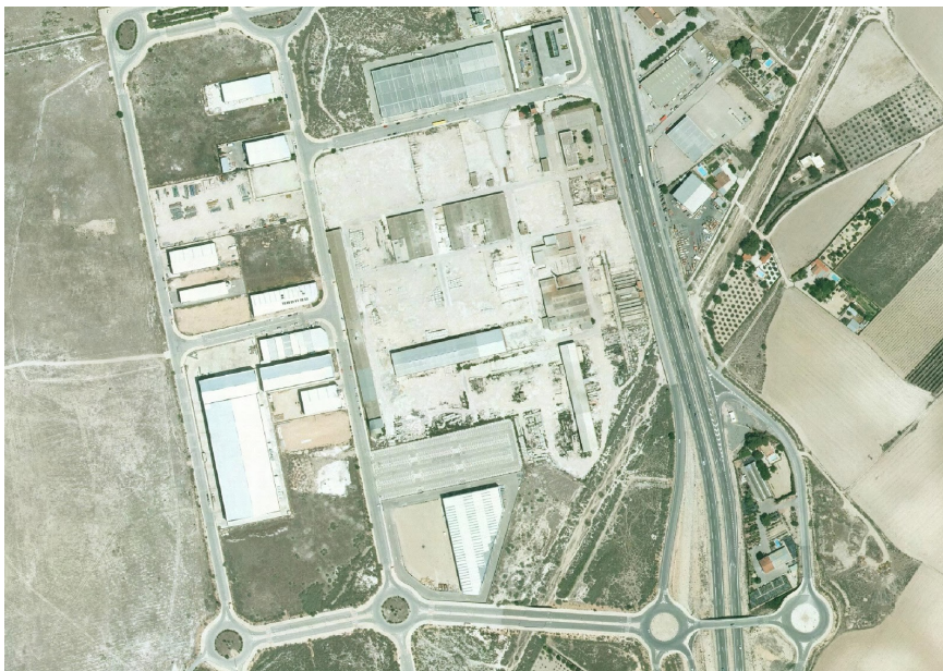
22. Foto 9

Valoración de la trama. Marca solo un óvalo.