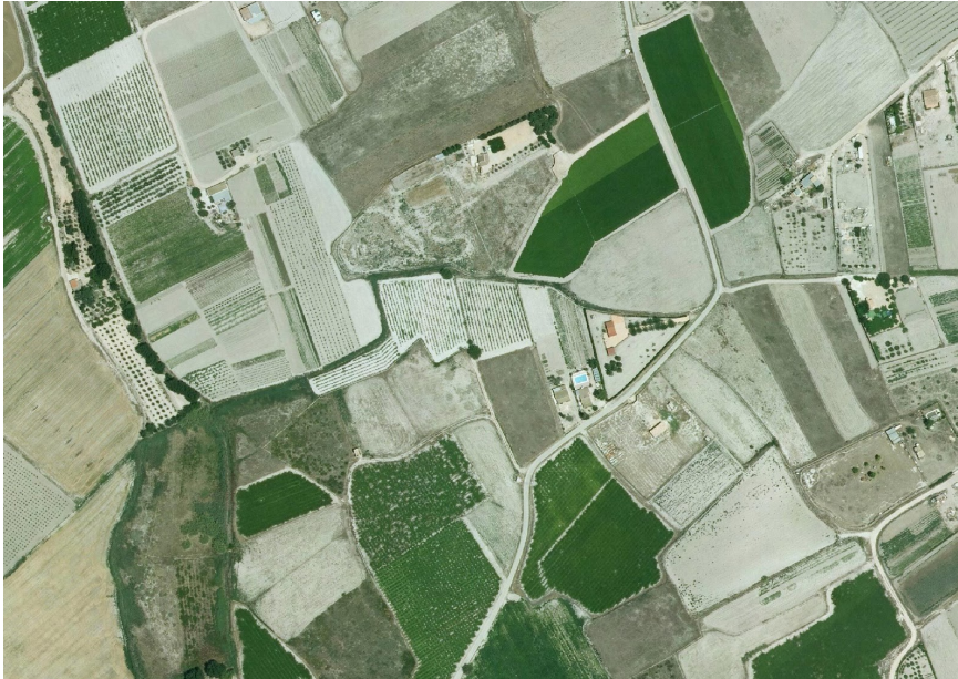
21. Foto 8

Valoración de la trama. Marca solo un óvalo.