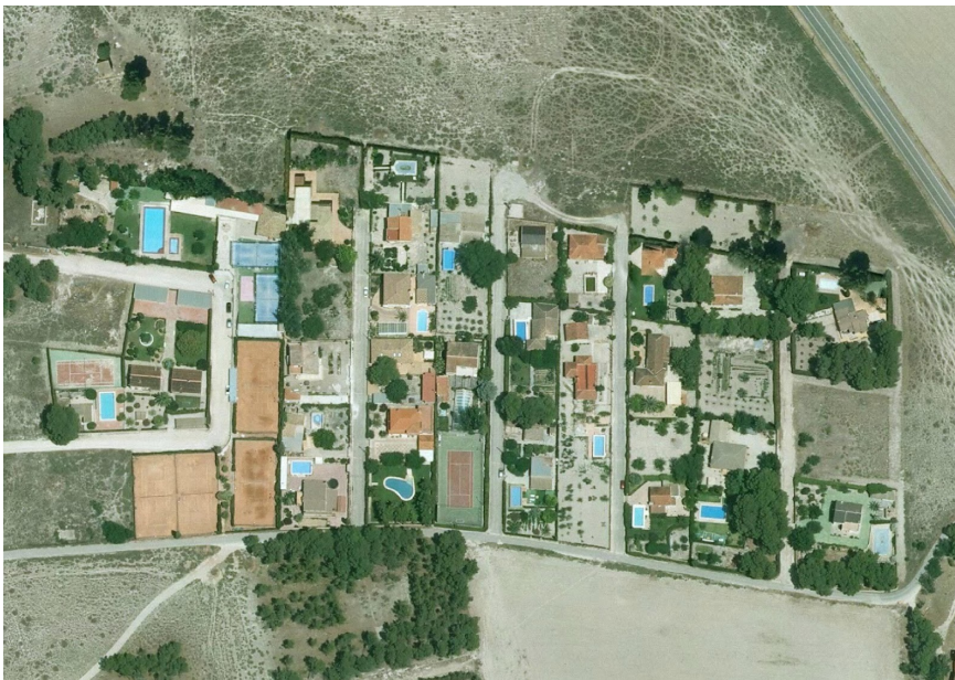
24. Foto 11

Valoración de la trama. Marca solo un óvalo.