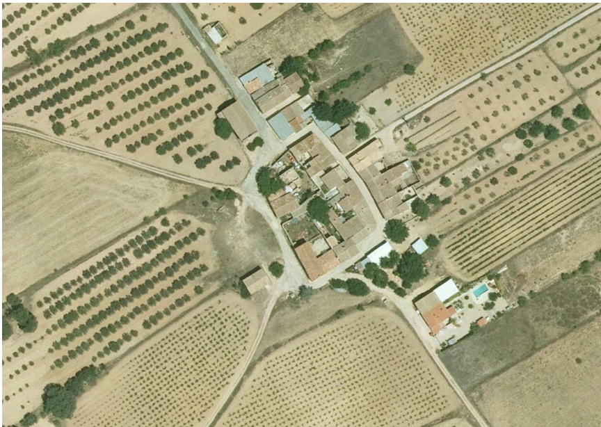
28. Foto 15

Valoración de la trama. Marca solo un óvalo.