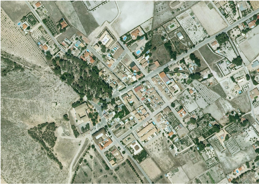
29. Foto 16

Valoración de la trama. Marca solo un óvalo.