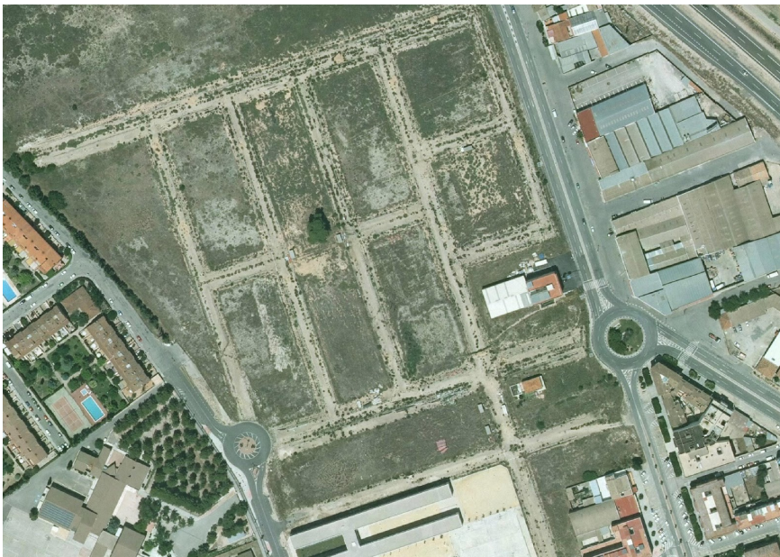
18. Foto 5

Valoración de la trama. Marca solo un óvalo.