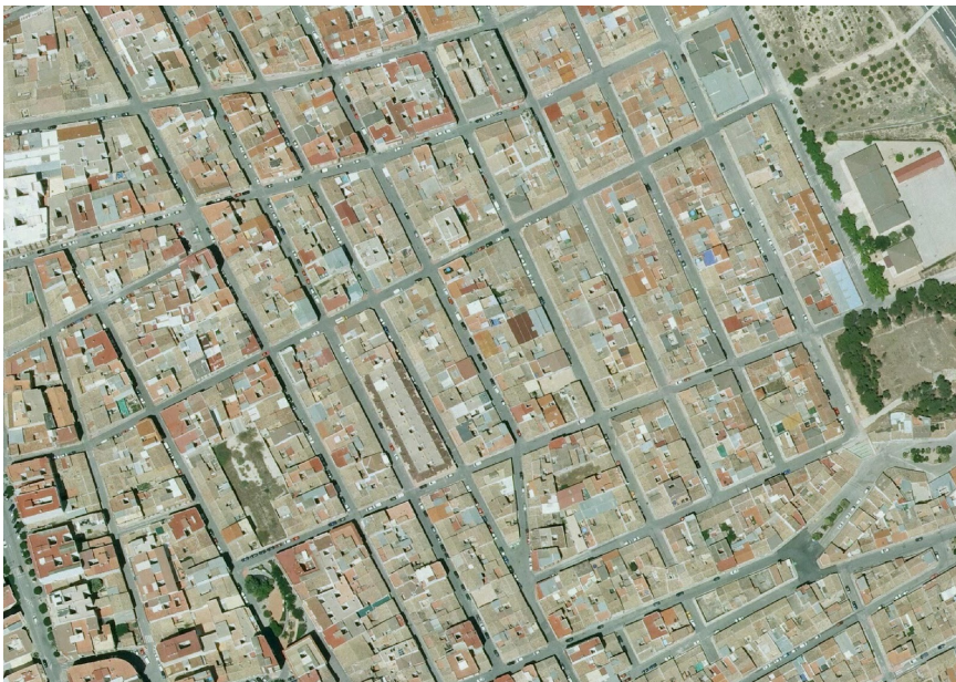
16. Foto 3

Valoración de la trama. Marca solo un óvalo.